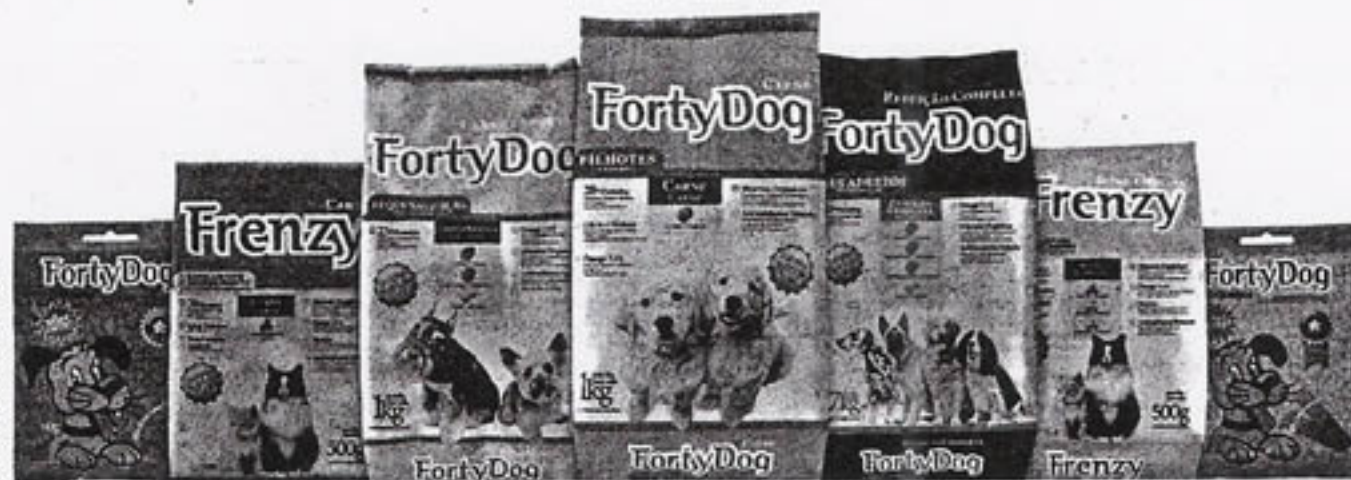
Empresa gaúcha produz atualmente 300 toneladas/dia das duas linhas

Para tomar para si parte do mercado dominado por empresas do porte da Nestlé, fabricante da Purina, e da Masterfoods, da Pedigree, a Josapar dá passos de formiguinha: foram dez anos de estudo até a produção do primeiro lote de rações, em parceria com a fabricante pelo-