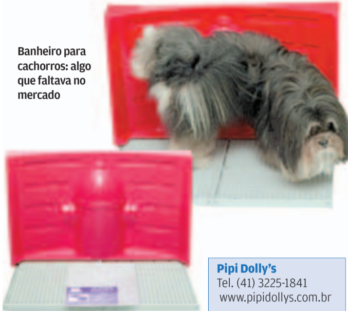
Banheiro para cachorros: algo que faltava no mercado

Pipi Dolly's Tel. (41) 3225-1841 www.pipidollys.com.br